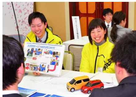
▲各ブースに分かれて説明を受けました

この企業説明会は、学生たちにとって企業の採用担当者と直接面談し、就職情報をGET!できるチャンスです。各企業のブースを見渡すと、自信と誇りに満ちたOBたちの姿も数多くあり、『 昨年入社した先輩たちは、今どのような仕事をしていますか? 『やりがいを感じる時はどのような時ですか?』 『研修制度について教えてください。』 』など積極的に質問する学生たちへ笑顔で答えていました。終了後の学生たちから、『 緊張したけど採用担当者やOBと話ができて良かった! 』など充実の表情で報告がありました。新潟工業短期大学では、『 学生ひとりひとりの希望に合わせた就職を実現させる 』ため、就職支援室を中心に様々な進路支援を行っています。だから就職率100%なんですね!