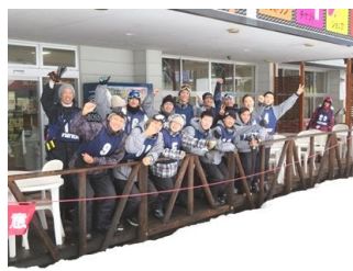
▲ロッジ前で記念撮影

2月20日(水)学生&教職員の希望者を募り・・・『 スキー・スノボツアー in ニノックス 』を開催しました(^^) / 冬の新潟と言えば、やっぱり ENJOY SNOW SPORT ですよ! スキースクール組は、講師の先生が基本から丁寧に指導。1時間も経たないうちに、リフトに乗ってコースデビュー(早っ!) 一方、経験者はあいにくの雨模様の中、ガンガン楽しんでいました(^^) / クルマで1時間程度走るとスキー・スノボが楽しめ、また、家に帰って来るとバイクにも乗れる・・・そんな新潟工業短期大学周辺です(^^) /