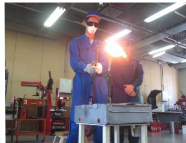
▲切断用の吹管を使用して、厚さ6ミリ鋼板の切断にチャレンジ!