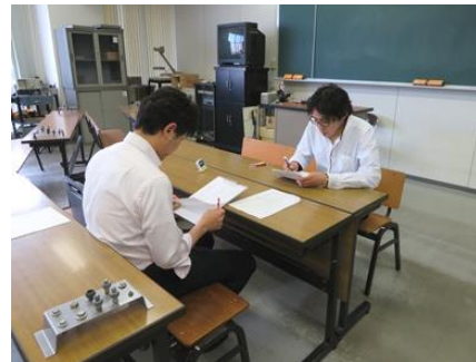
▲口述試験のトレーニング中！

『整備内容説明』の2問題で構成。試験時間は各々5分間の 合計10分勝負！ 受験生の皆さん、口述試験『全員合格』を目指して頑張ってください。