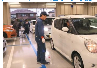
▲ライトの球切れを点検中

そこで、『安全なクルマやバイクで通学してほしい！』との願いから 新潟工業短期大学オリジナルチェックシート を使用して、ライトの球切れやタイヤの残溝などについて点検(^^)/ もちろん、点検は自動車実習担当の先生たちが実施しますが、専攻科（1級自動車整備士養成課程）の学生たちもサポート。『ナンバー灯が点灯しない！』など、ちょっとした不具合はスグにその場で修理(^^)/